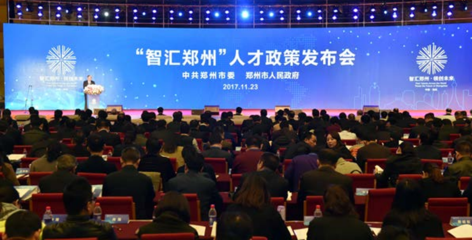
2017年“智汇郑州”人才政策发布会现场